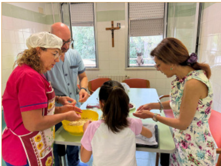
Attività per i malati in cucina durante la giornata del Sollievo all' Hospice di Ragusa

L'11 febbraio non sia solo una ricorrenza, ma un'occasione per rinnovare il nostro sguardo sulla sofferenza e per costruire una società più umana e solidale.